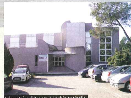
Laboratoire d'Orange à Sophia Antipolis

Astérix, Futuroscope, Walibi, Grévin..., tous appartiennent désormais à la Compagnie des Alpes, société créée il y a seulement 23 ans par la CDC pour exploiter des domaines skiables. Entrée au Second marché en 2002,